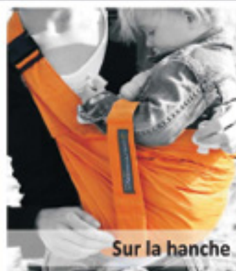
Sur la hanche